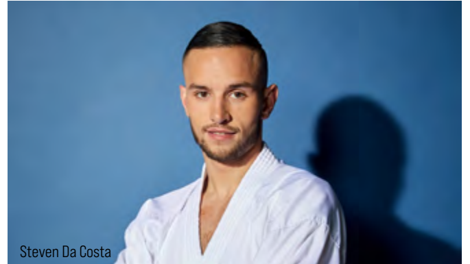
Steven Da Costa

Ceci dit, Bourges, avait déjà accueilli, l'an passé, les championnats de France. Blessé et opéré Steven Da Costa n'avait été qu'observateur. Après sa participation victorieuse, au tournoi du Caire, on l'attend en action sur les tatamis du Prado, du 4 au 5 mars. La compétition, l'an passé, bien que montée en hâte en raison de la finale la veille de l'Eurocoupe avait été une vraie réussite. D'où - chose exceptionnelle - la décision de la fédération de karaté de revenir une seconde fois dans notre ville. Et ceci avant les championnats d'Europe prévus du 24 au 26 mars en Espagne. Il y aura forcément au Prado un peu plus d'enjeux.