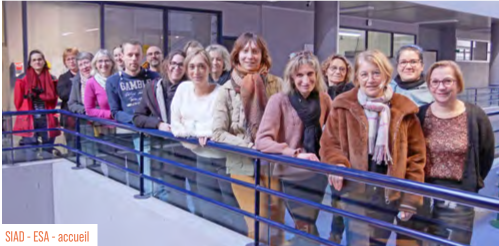
SIAD - ESA - accueil