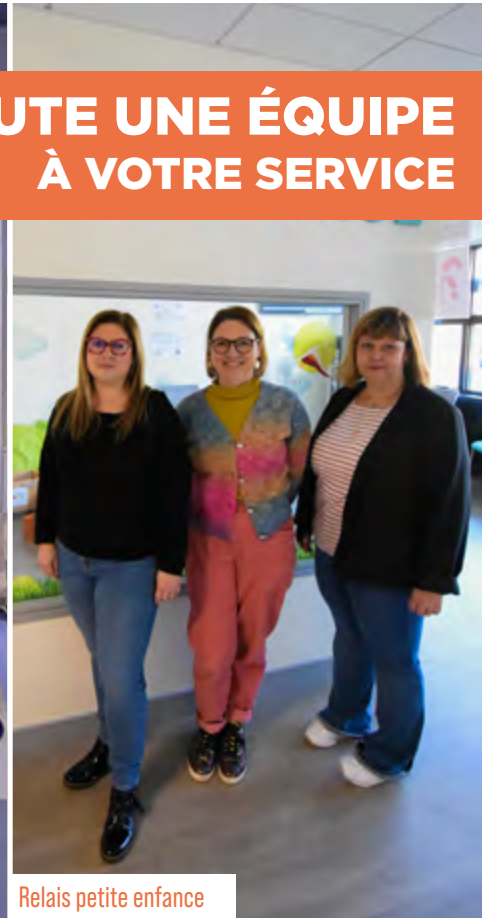
Relais petite enfance