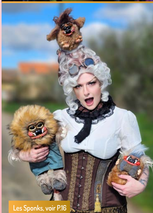
Les Sponks, voir P.16