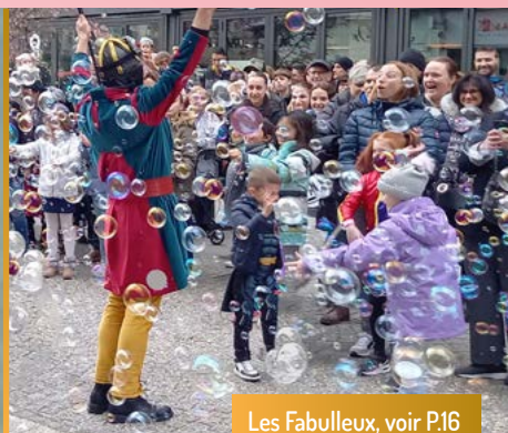
Les Fabulleux, voir P.16