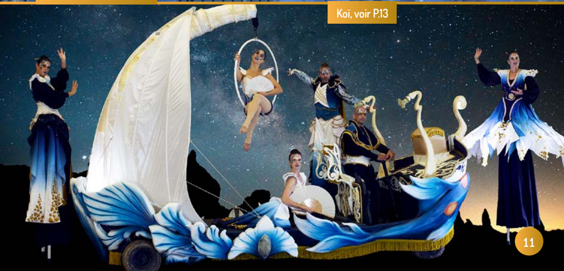
Koï, voir P.13