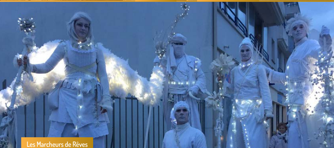
Les Marcheurs de Rêves