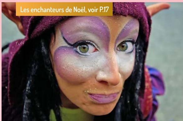
Les enchanteurs de Noël, voir P.17