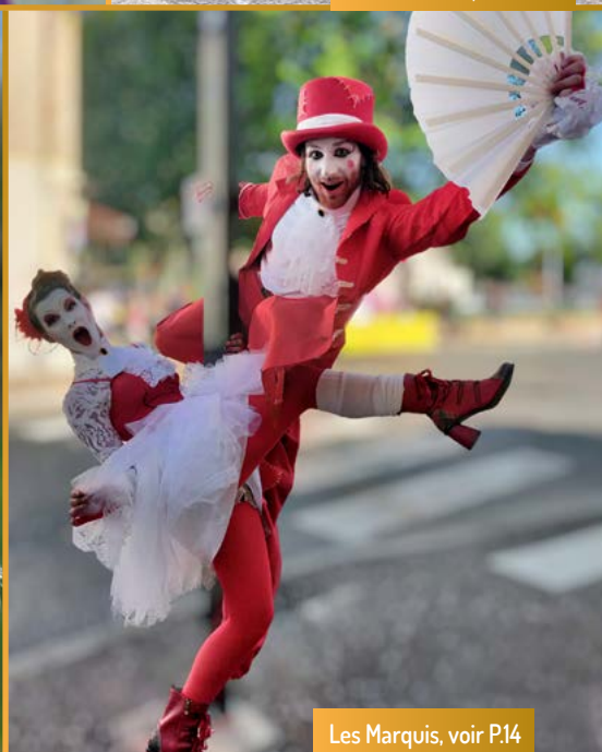
Les Marquis, voir P.14